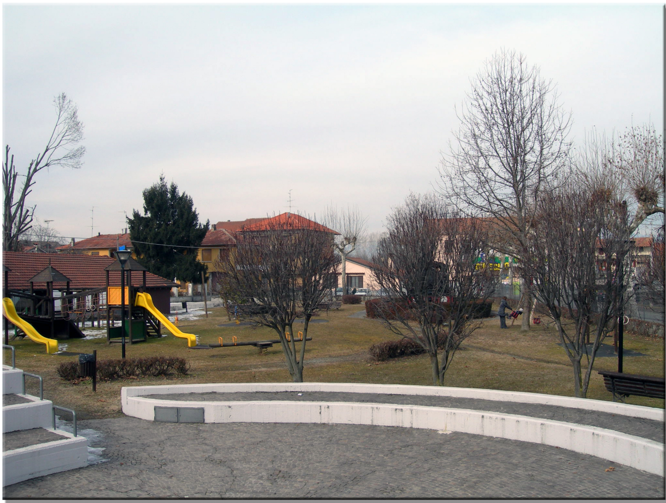
PUNTO FOTOGRAFICO 2 STATO DI ATTUALE - VISTA PANORAMICA DA VIA TORINO INCROCIO CON VIA PIETRO MICCA COMUNE DI CARPIGNANO SESIA 202 m.s.l.m. AZIMUT 100°